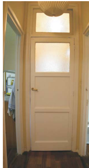
Puerta de aseo, con zonas translúcidas para la iluminación del pasillo. Fotografía: MMN Arquitectos, Oct. 2003.