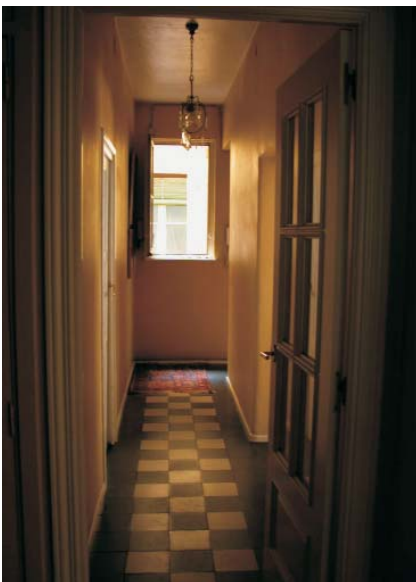
Pasillo de Rodríguez San Pedro 72. Fotografía: MMN Arquitectos, Oct. 2003.

Hacer desaparecer el vestíbulo, como ya ha ocurrido en algunas viviendas, es romper uno de los principales objetivos de la Casa de las Flores y vulgazar el edificio desde el interior del mismo.