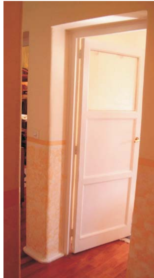
Interior de una vivienda en Hilarion Eslava, 2.