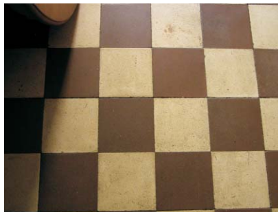
Detalle de solado de baldosa hidráulica en damero en baño. Rodríguez San Pedro 70, 2ª izqdaA. Fotografía: MMN Arquitectos, Nov. 2003