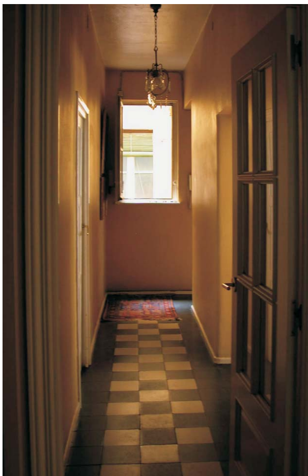
Vivienda en Rodríguez san Pedro, 72. MMN Arquitectos, Oct-2003