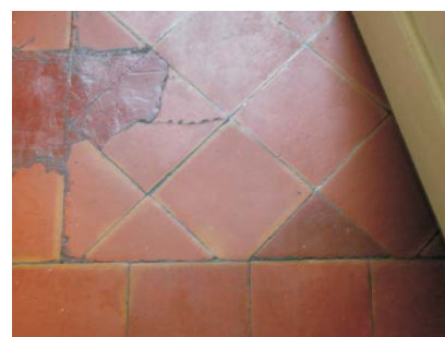
Detalle de solado de baldosin en cocina. Rodríguez San Pedro 70, 2ª izqdaA. Nov. 2003