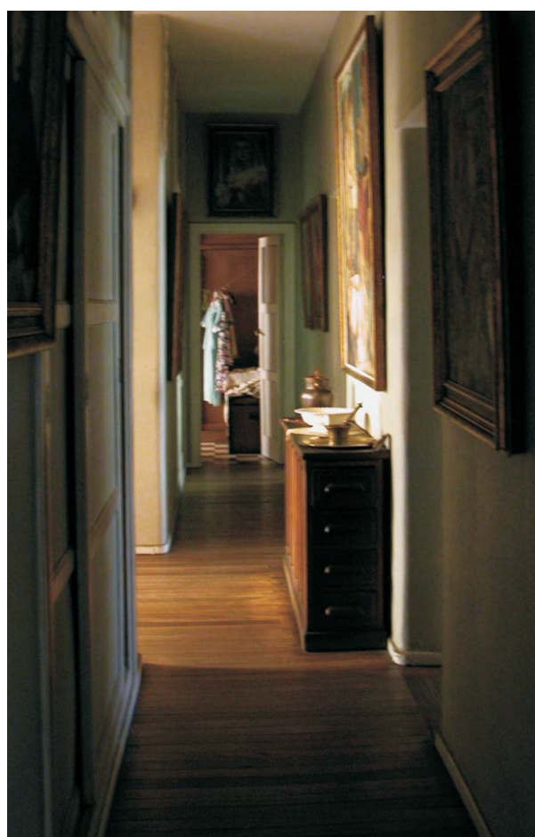
Vivienda en Rodríguez san Pedro, 70. MMN Arquitectos, Nov-2003