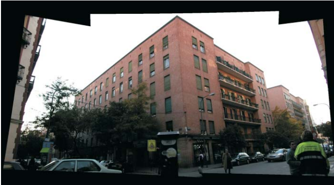
Fachada a Meléndez Valdés y Gaztambide. Fotomontaje: MMN-Arquitectos, Oct. 2003.