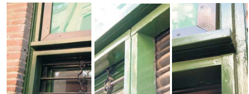
Escaparate en Meléndez Valdés 59. Oct. 2003. Con los medios de que disponemos no estamos en condiciones de afirmar categóricamente que éste es un local original, pero sí es cierto que conserva muchos de los elementos que son propios del edificio: La carpintería de madera maciza, pintada en un verde semejante al de otros elementos de fachada, las rejas de hierro con los motivos que encontramos en otros huecos... Pero sobre todo es respetuoso con la línea de imposta que marca el dintel del portal y que se prolonga en el local separando cartel de escaparate, y con el zócalo de ladrillo que separa el hueco de la acera.