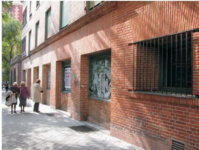
Local comercial en Gaztambide 17. MMN Arquitectos. Oct. 2003.