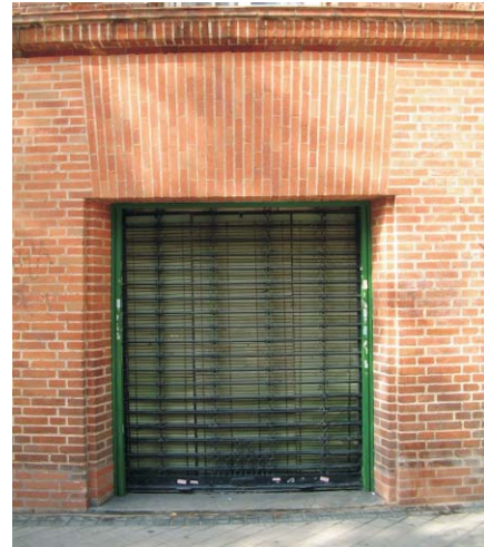
Local comercial en Gaztambide 17. MMN Arquitectos. Oct. 2003.