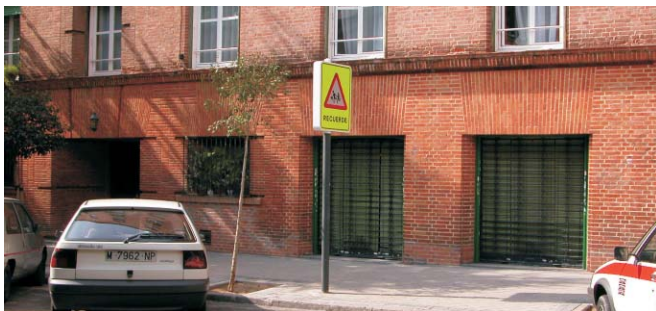
Local comercial en Gaztambide 17. MMN Arquitectos. Oct. 2003.