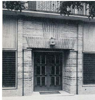
Fotografía actual de Meléndez Valdés 61 (MMN Arquitectos. Oct. 2003) y fotografía sin datar extraída de Maure, L. "Zuazo", 1989. Servicio de Publicaciones del CCAM. Hubo un momento en que el escaparate del actual Herza fue simétrico respecto del portal, como estaba proyectado originalmente. Sin embargo creemos que la remodelación es muy antigua, nadie parece recordar el estado original...