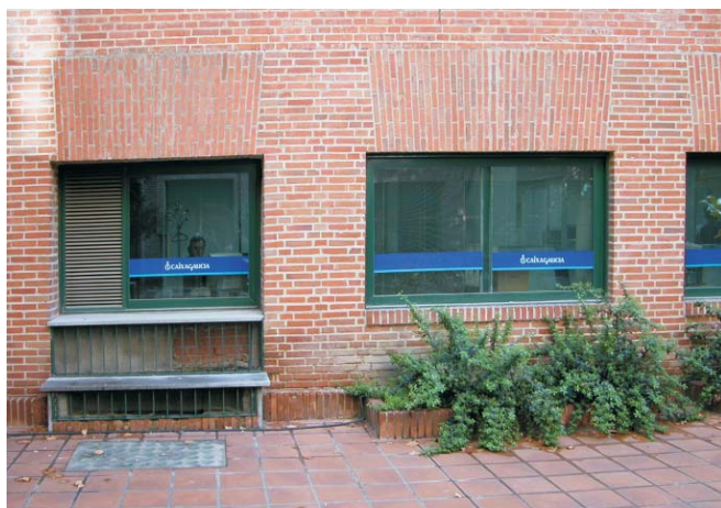
Local comercial en Rodríguez San Pedro, 70. MMN Arquitectos. Oct. 2003.