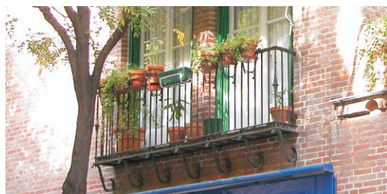
Rodríguez San Pedro 72 a calle. En éste, y en el 70, encontramos balcones con dos huecos. La configuración es como el tipo individual a jardín.

Desde un punto de vista funcional se trata de elementos de protección para evitar caídas. Compositivamente, como se señala en las fichas de fachadas y huecos, ayudan a matizar el zócalo del edificio y para establecer una cierta jerarquía en las viviendas según la norma clásica de añadir valor al "principal". Por otra parte, en el caso de los balcones de Hilarión Eslava 2 y 6 a la calle, se trata de destacar el portal que tienen inmediatamente debajo.