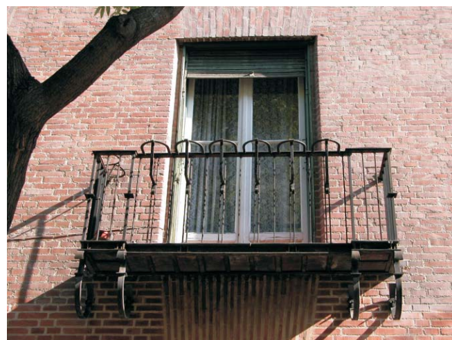
Hilarión Eslava 2 a la calle. Los balcones a la calle presentan modificaciones respecto a los del patio. MMN Arquitectos, Oct. 2003