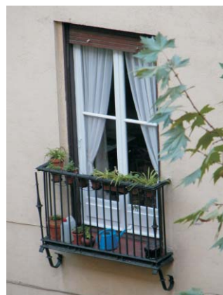
Gaztambide 19 a jardín.