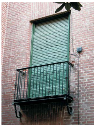
Meléndez Valdés 59. a jardín