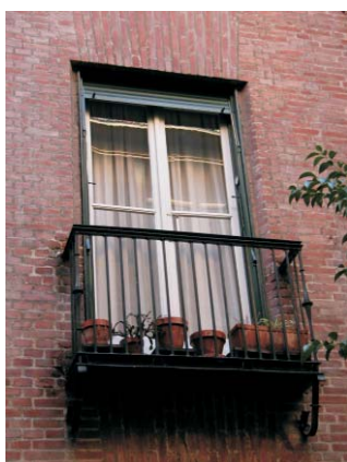
Rodríguez San Pedro, 70. a jardín