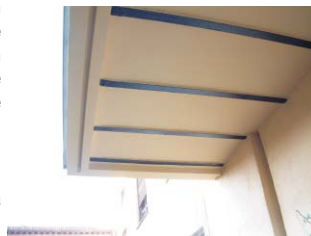
Retranqueo en fachada con cambio de plano y línea de sombra.Dibujo: MMN Arquitectos. Oct. 2003.