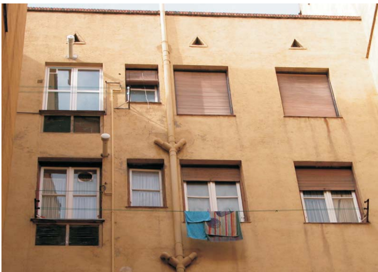
Patio interior en Rodríguez San Pedro, 70. MMN Arquitectos. Oct-2003.