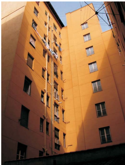
Patio interior en Gaztambide 17. MMN Arquitectos. Oct-2003.