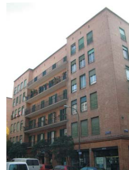
Esquina Meléndez Valdés con Hilarion Eslava. MMN Arquitectos, Nov-2003