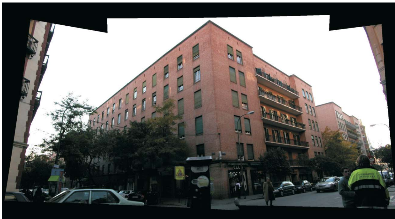
Fotomontaje de la esquina de Meléndez Valdés con Gaztambide. MMN Arquitectos, Nov-2003