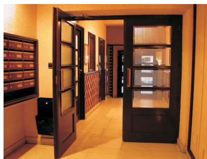
Portal de Gaztambide 21. MMN Arquitectos Nov. 2003