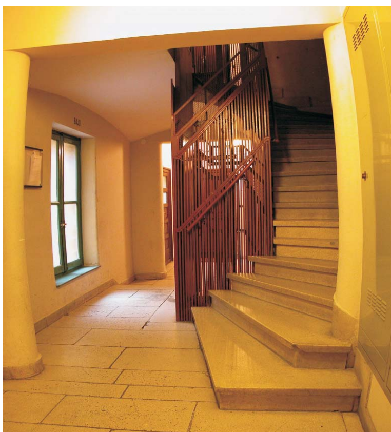
Portal de Gaztambide 17. MMN Arquitectos Nov. 2003