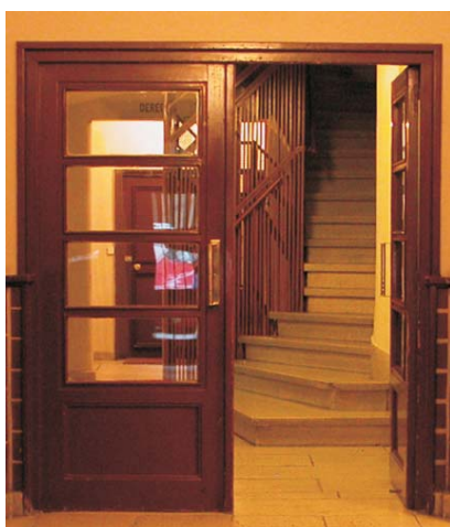
Portal de Gaztambide 17. MMN Arquitectos Nov. 2003