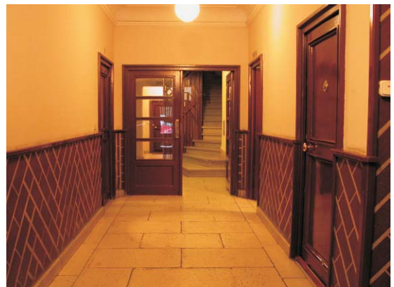
Portal de Gaztambide 17. MMN Arquitectos Nov. 2003

Es importante hacer hincapié en la configuración de las porterías, que debe conservarse, así como los elementos comentados anteriormente: zócalos, techos, puertas... que se deben mantener como eran originalmente.