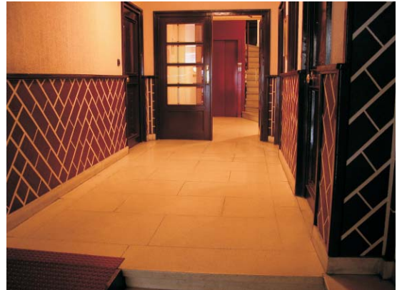
Portal de Gaztambide 21. MMN Arquitectos Nov. 2003