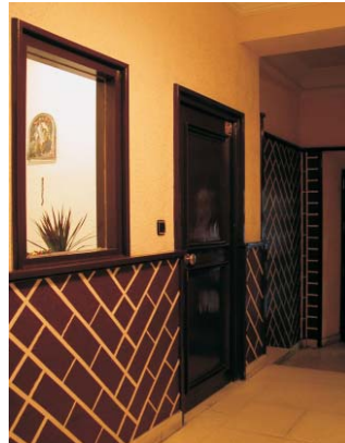
Portal de Gaztambide 21. MMN Arquitectos Nov. 2003