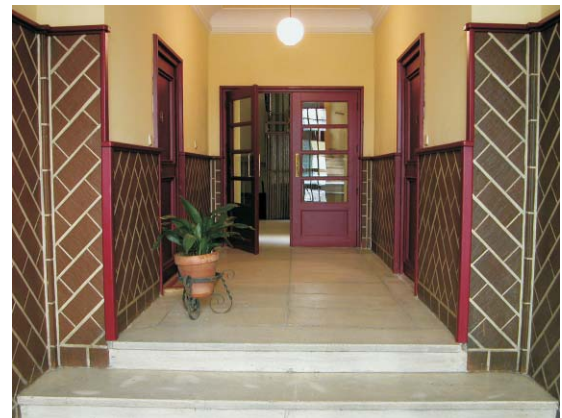
Portal de Gaztambide 19 hacia jardín. MMN Arquitectos Nov. 2003