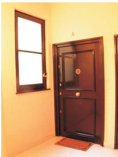
Meléndez Valdés 61. MMN Arquitectos, Oct. 2003