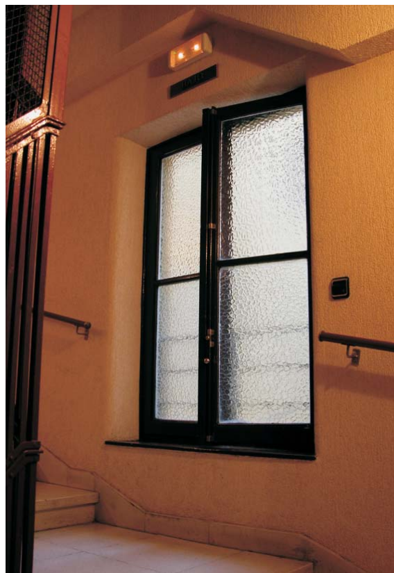
Gaztambide 21. MMN Arquitectos, Nov. 2003