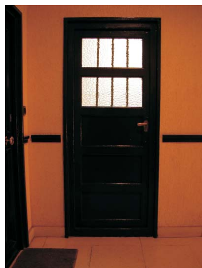
Gaztambide 21. MMN Arquitectos, Nov. 2003