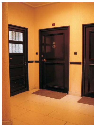
Gaztambide 21. MMN Arquitectos, Nov. 2003