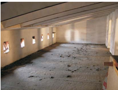
Buhardillas en Gaztambide 19. MMN Arquitectos, Oct-2003

El mantenimiento propio de una cubierta inclinada de teja. Es esencial recuperar el uso , por ejemplo como local de vecinos (no añade edificabilidad actualmente).