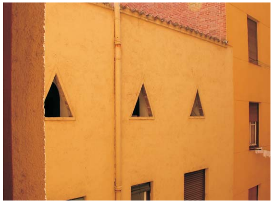
Fachada a patio en Gaztambide 19. Los huecos son triángulos equiláteros que no se corresponden con los interiores. MMN Arquitectos, Oct-2003