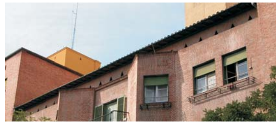
Fachada a calle Gaztambide. El plano de cerramiento de buhardilla se retraquea para formar claramente un cuerpo de coronación de fachada. MMN Arquitectos, Oct-2003