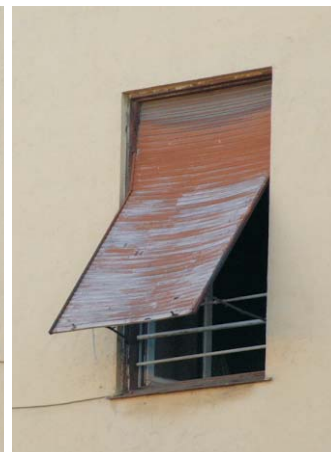
Persiana original en posición normal y utilizada como toldo. Fotografías: MMN Arquitectos, Oct. 2003.