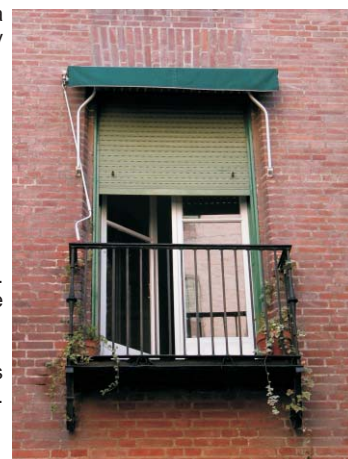
Toldos de tela en balcones que contaban originalmente con persianas-toldo (RP-70). Oct. 2003

El problema es bastante grave dada su generalización. Su recuperación sería fundamental para la armonía del conjunto.