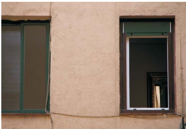
Variaciones no sólo de material, sino también de proporciones, color. (MV-59) También se han añadido capialzados de aluminio al exterior.