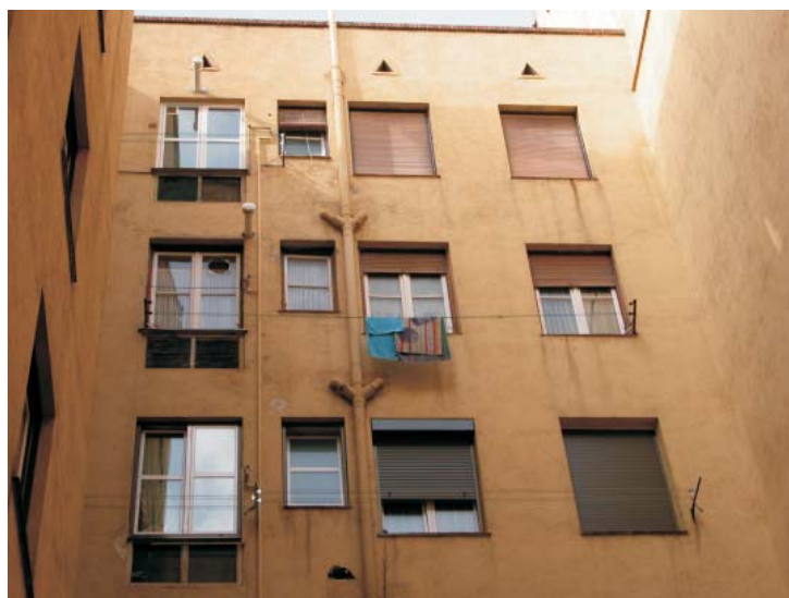
Patio interior en Rodríguez San Pedro 70.