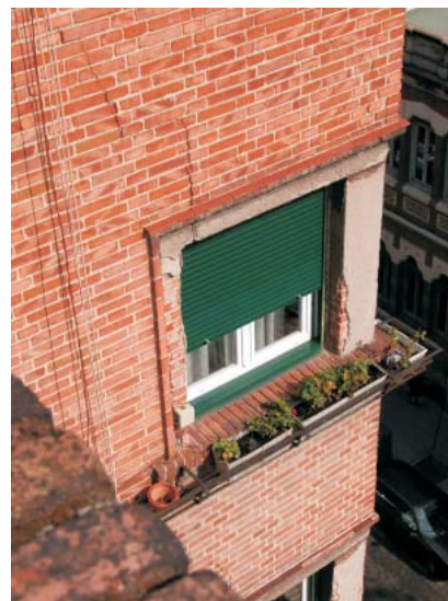
Planta a calle Rodríguez San Pedro 70.