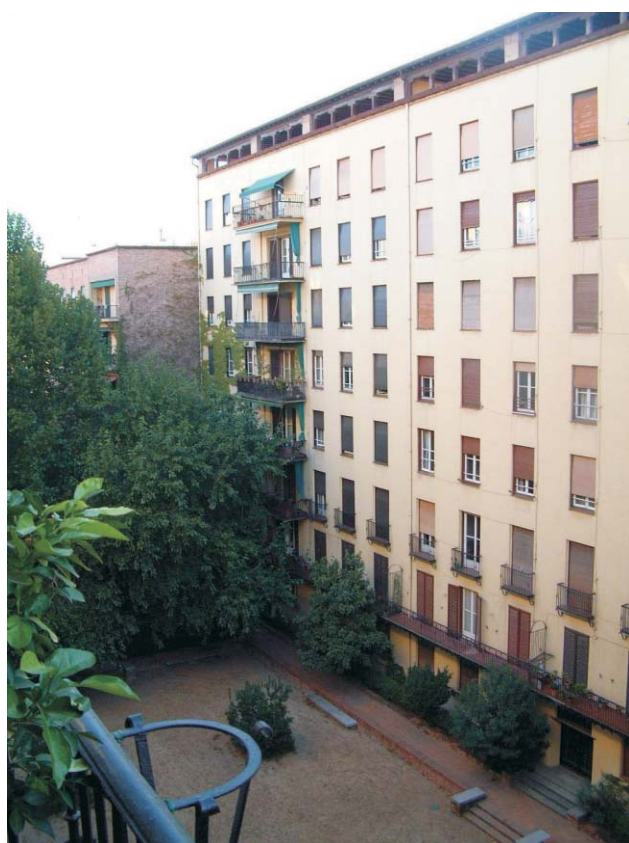
Sustitución generalizada de persianas. Foto MMN arquitectos. Oct. 2003