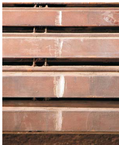
Detalle de las lamas de madera originales.