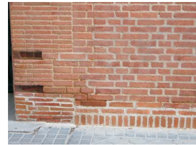
Reparación en Hilarión Eslava, 2, MMN Arquitectos, Oct. 2003