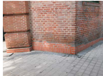
Reparación en Gaztambide 21, MMN Arquitectos, Oct. 2003