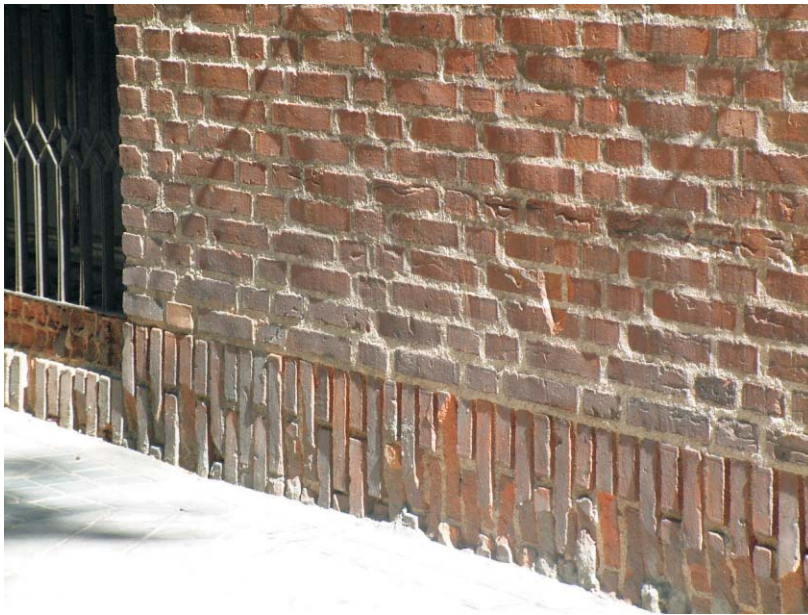
Zócalo en inmueble Meléndez Valdés 61, fachada a Hilarión Eslava. MMN Arquitectos, Oct. 2003