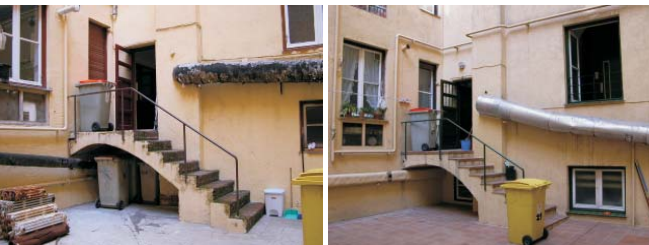
Alteraciones de solados en patio y escalera. Chimeneas y tuberías de todo tipo. Octubre 2003.