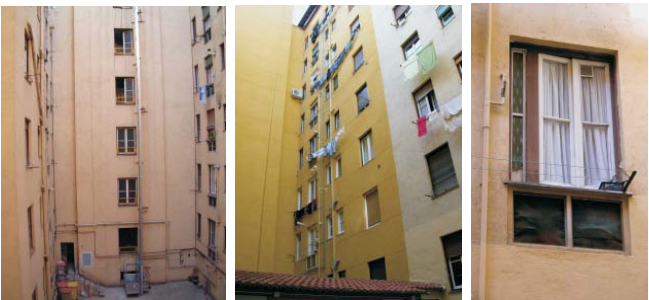
Fotos de alteraciones en elementos de los patios, especialmente las ventanas. Es patente el mal estado de conservación, la aparición de elementos extraños y la falta de uniformidad en las soluciones adoptadas. Octubre 2003.