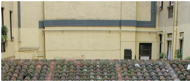
Conducciones de agua. Octubre 2003.