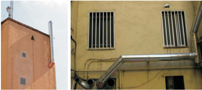
Chimeneas de calefacción. Octubre 2003.