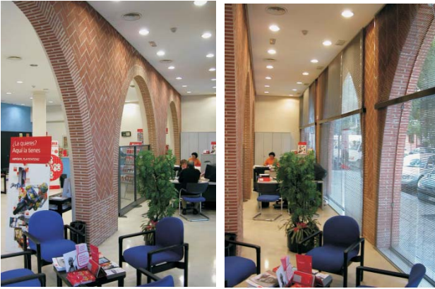
Fotos 2 y 3- Reposición de los arcos de la fachada interior en la oficina bancaria de RP-72. Octubre 2003.