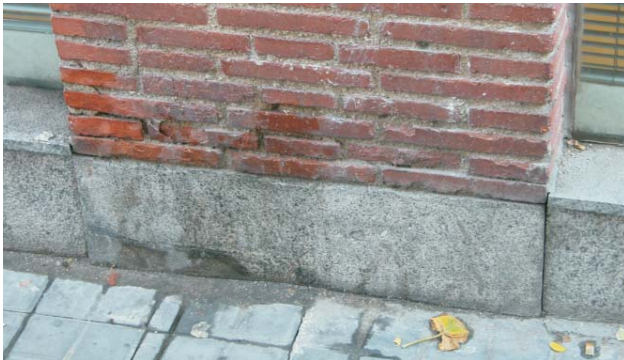
Foto 2'- Zócalos a pie de arcos recubiertos con chapados de piedra. Octubre 2003.