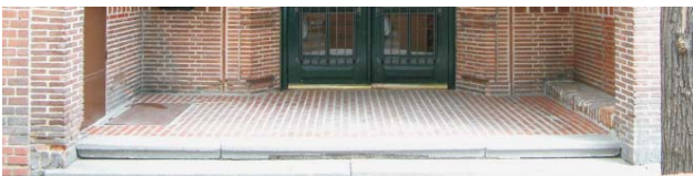
Foto 4- Pavimento a sardinel en el soportal de acceso a las viviendas Octubre 2003.