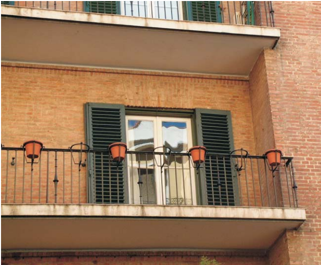
Restauración errónea de bandejas en Meléndez Valdés 59.