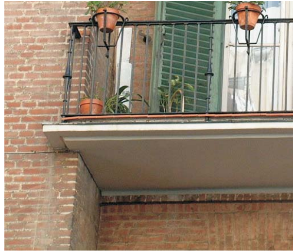
Restauración correcta de las bandejas de Meléndez Valdés 61.