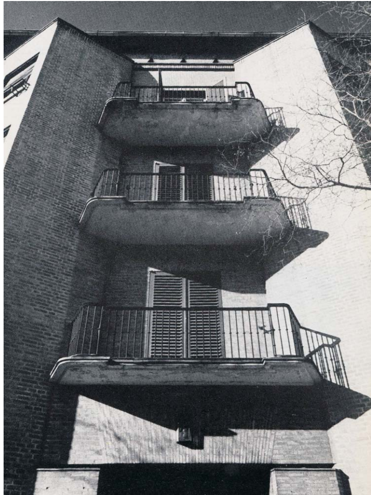
Arriba: Detalles de bandejas en la el detalle actualmente existente. Obsérvese la menor delicadeza del detalle en comparación con el inicial que se observa en la foto de la derecha. Fotografías: MMN Arquitectos, Oct. 2003