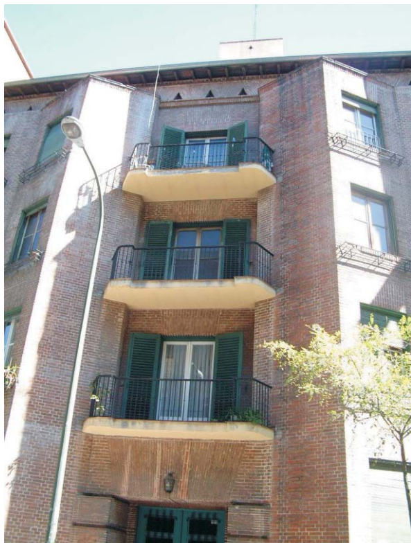
Bandejas de Hilarion Eslava, 4. Fotografía: MMN Arquitectos, Oct. 2003