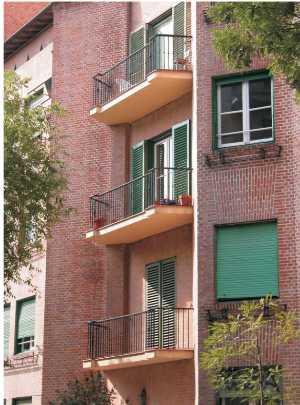
Bandejas de Gaztambide, 19. Fotografía: MMN Arquitectos, Oct. 2003